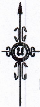
รูปแผนที่